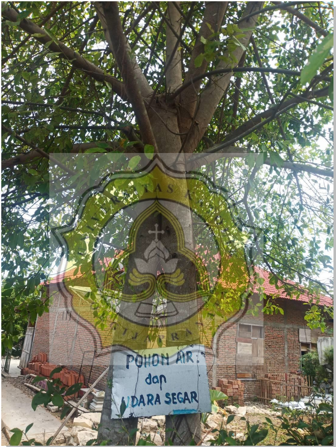
Foto 6. Pohon Beringin di Nguntoronadi