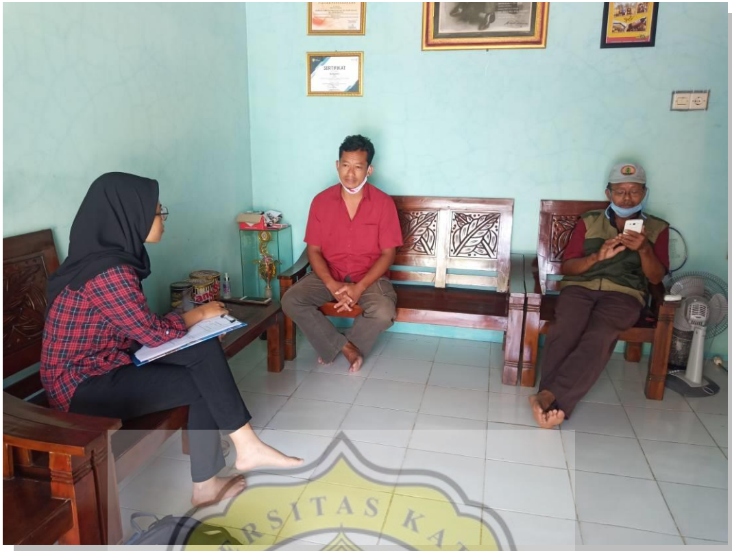
Foto 4. Wawancara dengan Ketua Karangtaruna Desa Watuagung