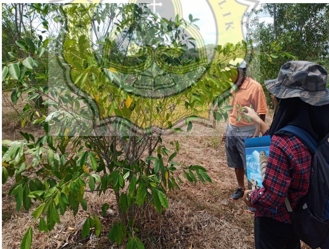
Foto 3. Lokasi Kegiatan Menanam Air dan Udara Segar di Bukit Jonambang