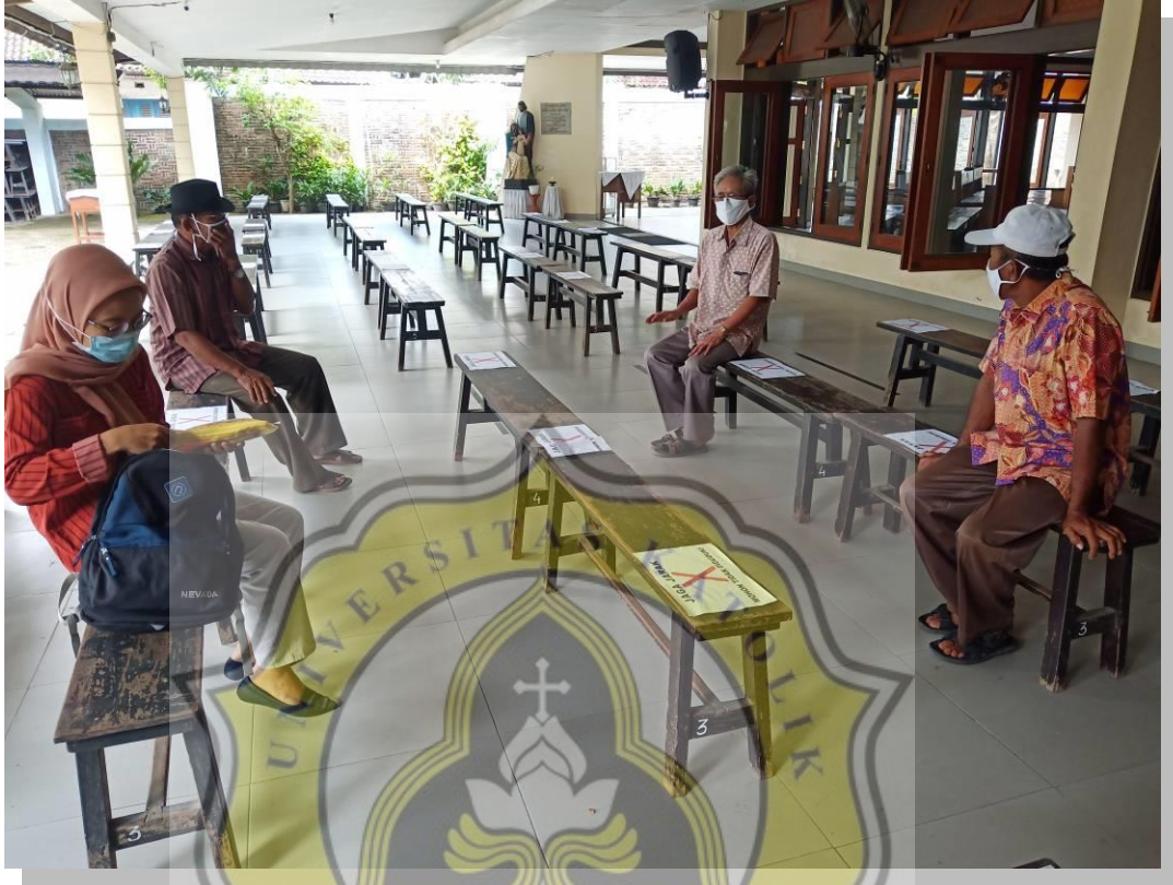
Foto 1. Kegiatan Pra-Penelitian di Paroki Santo Yusup Baturetno