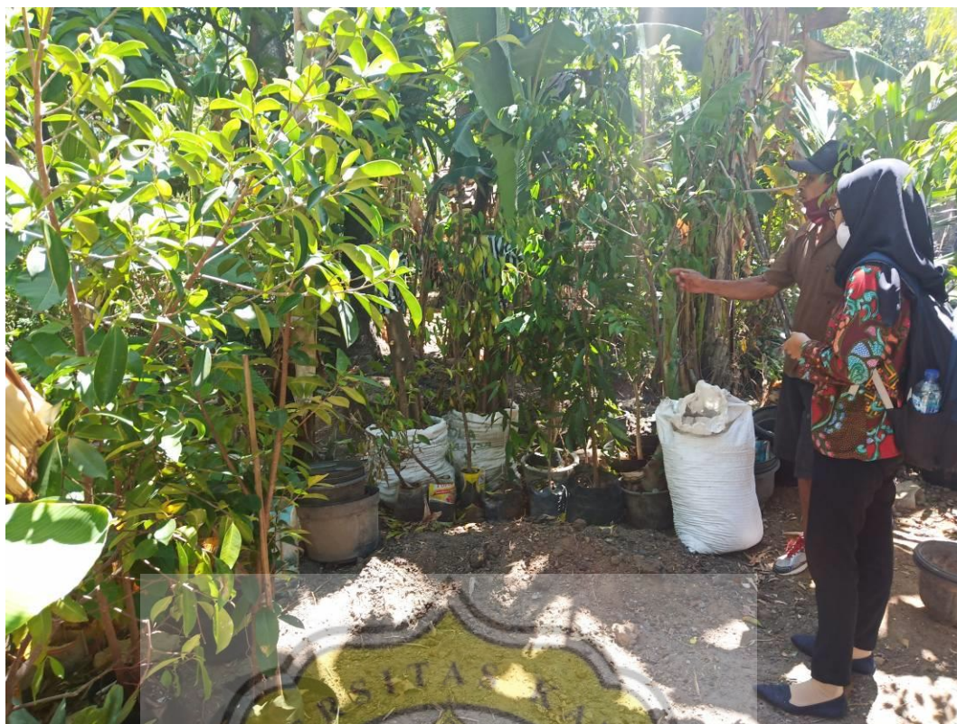
Foto 2. Lokasi Pembibitan Pohon Beringin di Baturetno