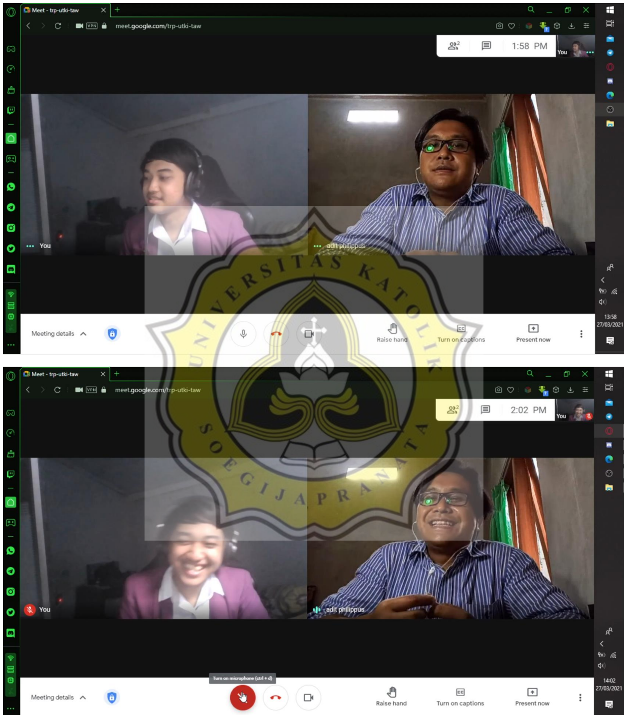
Lampiran 1 Wawancara dengan Guru BK