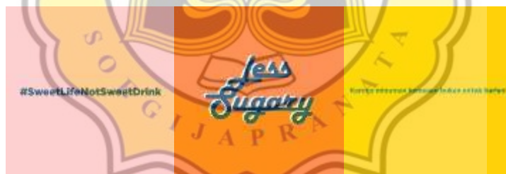
Gambar 4.4 Konten Pengenalan dan Coming Soon