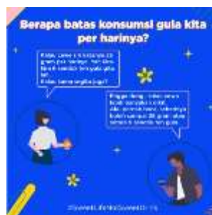
Gambar 4.5 Poster Digital (1)