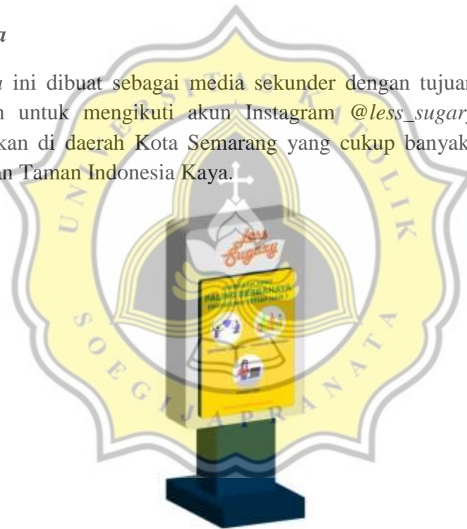
Gambar 4.11 Ambient Media

Ambient media ini dibuat sebagai media sekunder dengan tujuan untuk menarik lebih banyak target sasaran untuk mengikuti akun Instagram @less_sugary . Ambient media ini nantinya akan diletakkan di daerah Kota Semarang yang cukup banyak didatangi masyarakat yakni di Kota Lama dan Taman Indonesia Kaya.