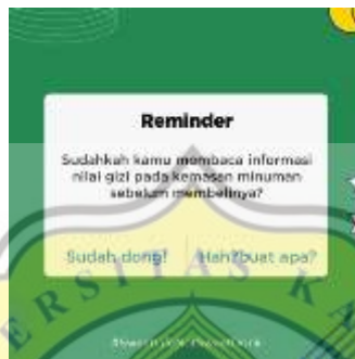
Gambar 4.7 Poster Digital (3)