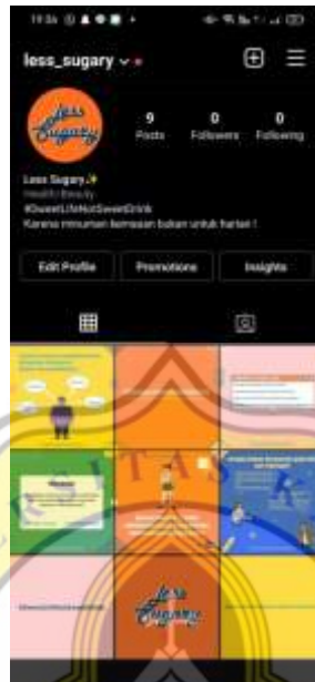
Gambar 4.3 Akun Instagram Less Sugary

juga ada yang berupa konten pengingat. Konten ini akan diunggah terus selama 1 (satu) bulan dengan intensitas upload sebanyak 2 (dua) kali upload tiap minggunya. Khusus minggu pertama, akan diunggah 3 (tiga) post berupa konten coming soon dan pengenalan. Lalu 3 (tiga) minggu berikutnya baru akan diunggah konten-konten informatif dan konten-konten pengingat sebanyak 2 (dua) post setiap minggunya. Jadi total akan diunggah 9 (sembilan) feed post selama seminggu.