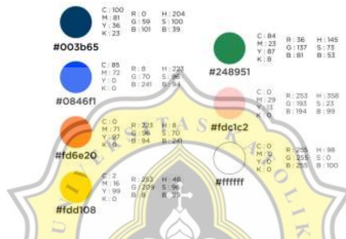
Gambar 4.1 Palet Warna

Warna-warna yang digunakan dalam poster adalah warna biru, merah, oranye, kuning, hijau, dan putih. Warna merah digunakan dengan tujuan untuk menarik perhatian karena warnanya mencolok. Warna biru digunakan karena warna biru memberi kesan menenangkan, memberi rasa aman, dan juga memberi kesan dapat dipercaya. Warna kuning digunakan karena warnanya cerah sehingga menimbulkan kesan fun , optimis, dan juga dapat menarik perhatian orang yang melihatnya. Warna hijau dapat memberi kesan santai dan menghadirkan perasaan menyenangkan bagi orang yang melihatnya. Warna putih akan banyak digunakan untuk warna dari font/tulisan yang ada di poster karena warna putih dapat membuat mata lelah jika terlalu mendominasi. Selain itu, warna putih juga merupakan warna penyeimbang yang sangat baik.