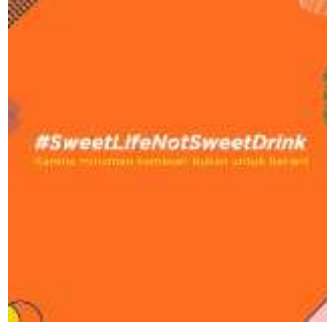
Gambar 4.9 Poster Digital (5)