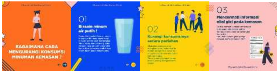
Gambar 4.6 Poster Digital (2)