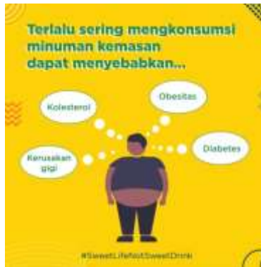
Gambar 4.10 Poster Digital (6)