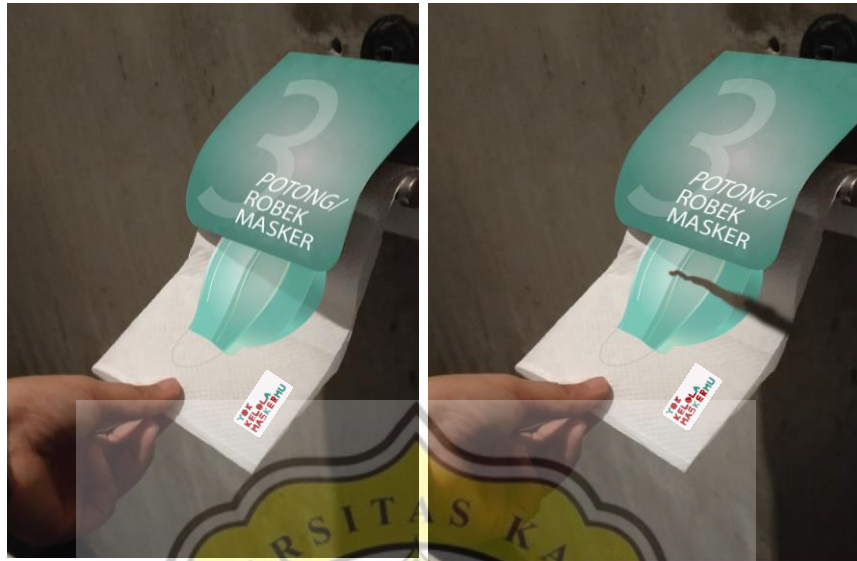
Gambar 4.5 Ambient Media Tahap 3 Tissue Belum Tersobek dan Sesudah Disobek