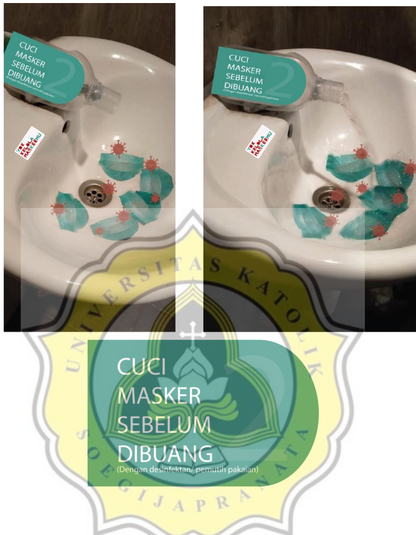
Gambar 4.4 Ambient Media Tahap 2 Ketika Air Tidak Mengalir dan Air Mengalir