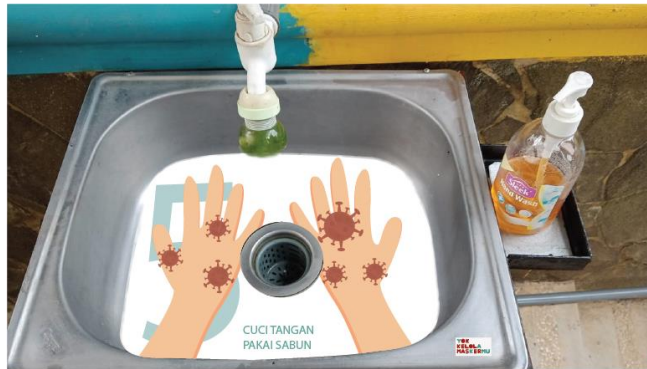
Gambar 4.7 Ambient Media Mencuci Tangan