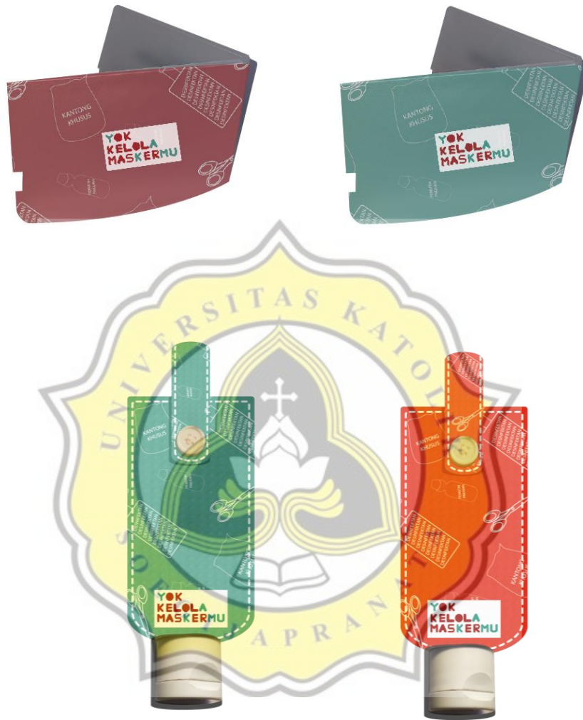
Gambar 4.9 Merchandise Mask Holder dan Pouch Hand Sanitizer