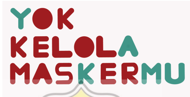
Gambar 4.1 Logo