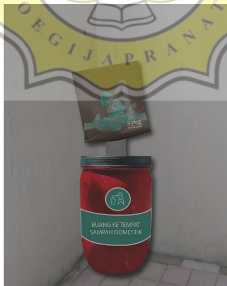
Gambar 4.6 Tempat Sampah Pada Toilet