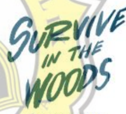
Judul Buku Saku