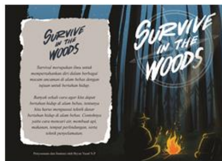
Cover buku depan dan belakang

Membuat sebuah buku yang berisikan informasi dan panduan tentang teknik bertahan hidup di alam bebas melalui komunikasi visual agar pembaca dapat dengan mudah memahami ilmu dari buku tersebut. Agar lebih praktis dan nyaman, dibuatlah buku saku dengan tujuan agar dapat dibaca di manapun dan kapanpun.