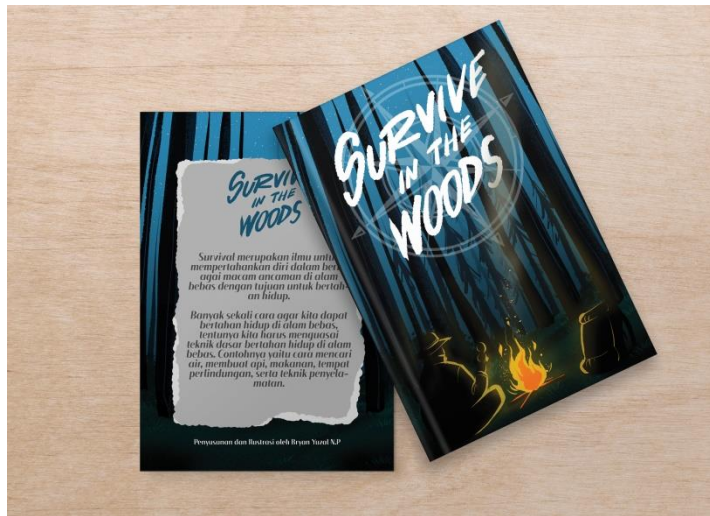
Gambar 15. Mockup Buku Saku