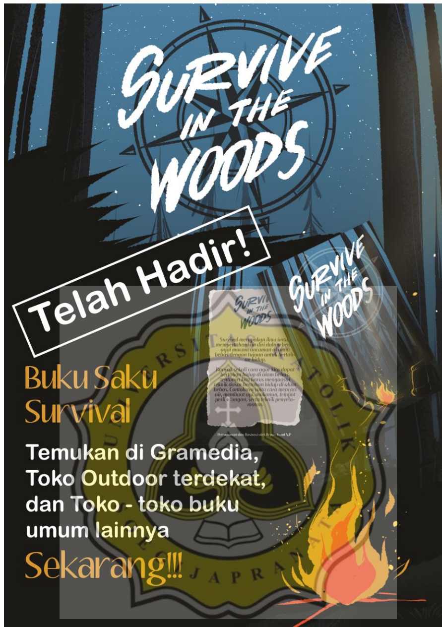
Gambar 14. Poster