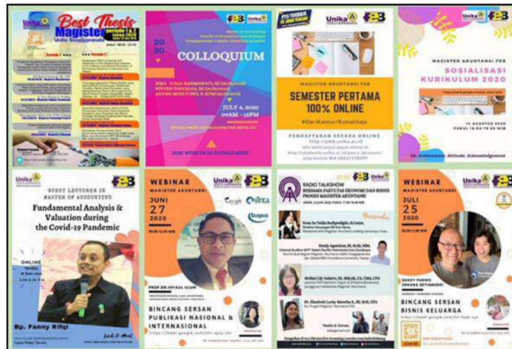
Gambar 2. Poster Kegiatan Daring Magister Akuntansi