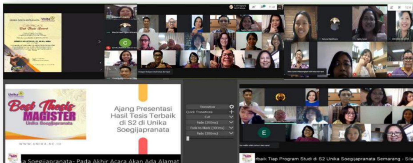
Gambar 1. Kegiatan Daring The Best Thesis

environment (VLE) pun tampak pada saat para panitia The Best Thesis melakukan optimalisasi platform baik dengan memutar video promosi masing-masing program studi, maupun memberikan sertifikat secara daring. Acara The Best Thesis ini juga memberikan sudut pandang yang berbeda oleh karena beragamnya studi ilmu yang dipresentasikan. Ilmu yang multidisiplin ini, memberikan warna tersendiri buat para peserta yang ikut di dalamnya. Hal ini dapat membuat wawasan para peserta terbuka akan perkembangan ilmu dari masing-masing multidisiplin itu sendiri. Acara ini dapat di tonton di link berikut ini https://youtu.be/bbQPqTxcl0I .