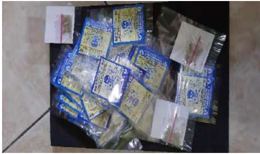
2. Racun Tikus “Ampuh”