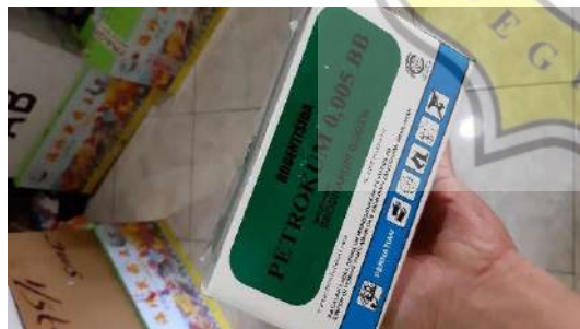
6. Obat Hama Tikus Langsung Umpan “Petrokum.”