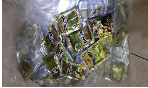
1. Obat Racun Hama Perkebunan “Maowang”