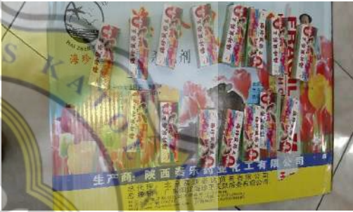
3. Obat Racun cair untuk tikus “Maowang”