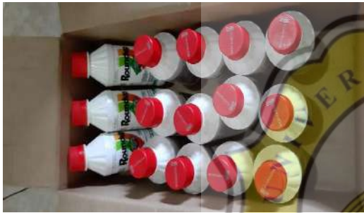
4. Obat Hama Rumput Liar “Roundup”