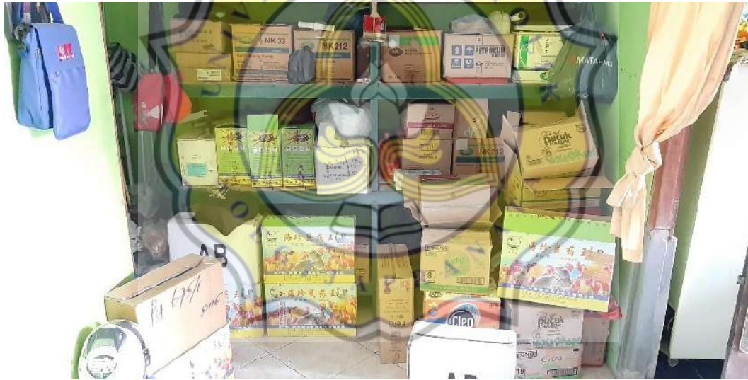
Kondisi Gudang tempat penyimpanan stock barang UD. Soember Oerip Pangestu”