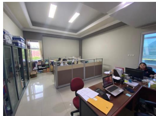
Gambar 4.2 Lokasi dan Tempat PT.Pelayaran Kayan Lestari Samudera