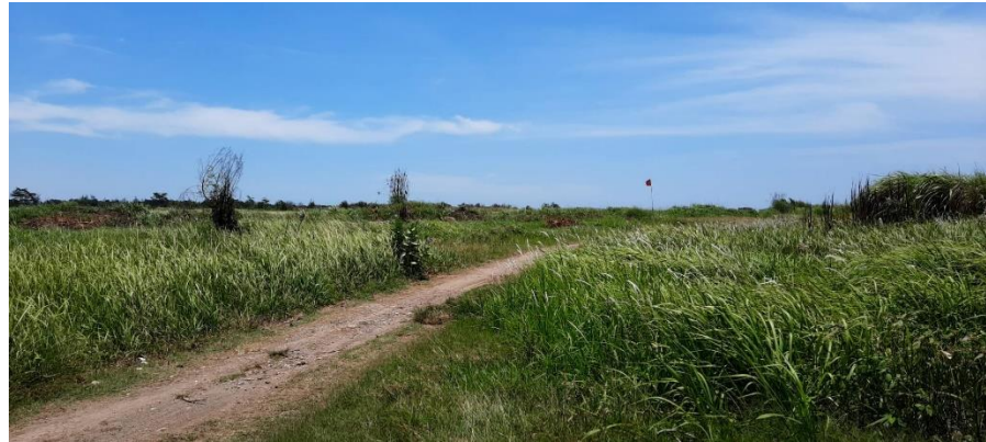
Gambar 47. Kondisi topografi pada tapak

terdapat kemiringan dengan arah menuju tepi pantai marina seperti gambar dibawah.