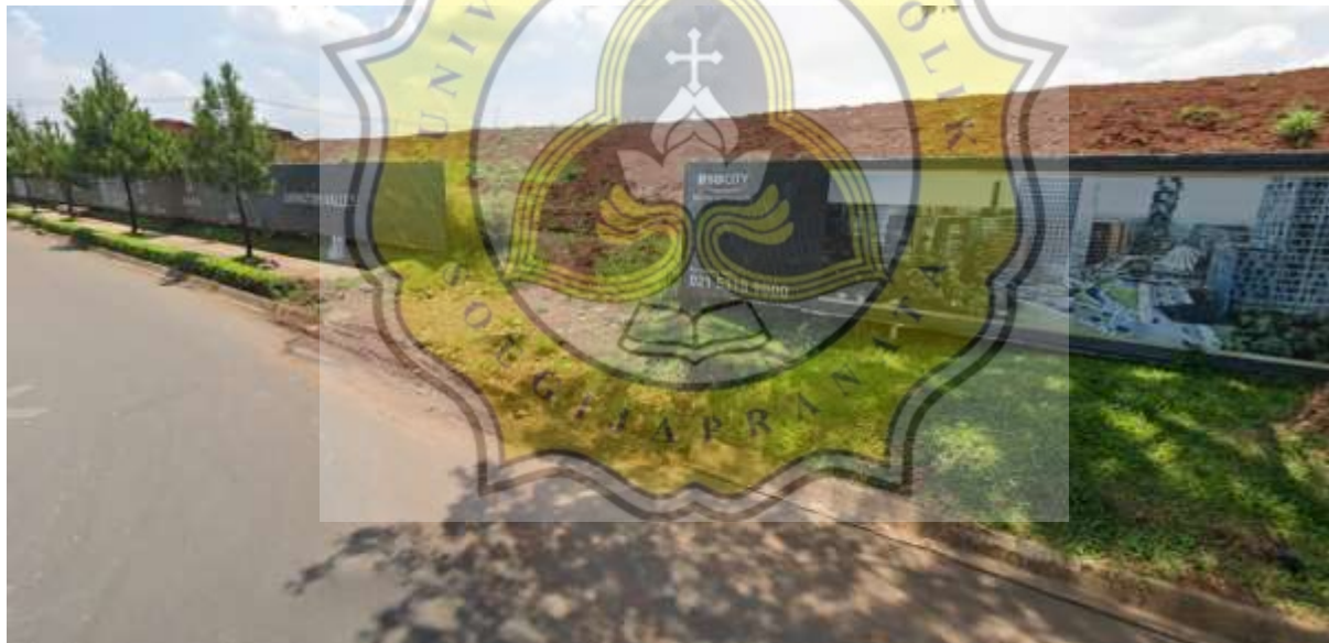
Gambar 66. Kondisi sekitar site