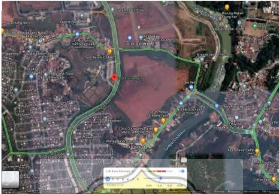
Gambar 65. Peta Lalu lintas BSD