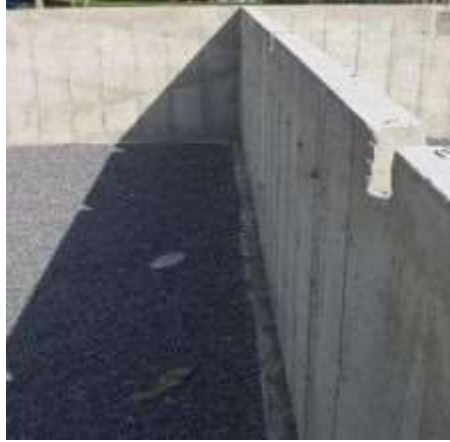
gambar 70. Dinding diafragma