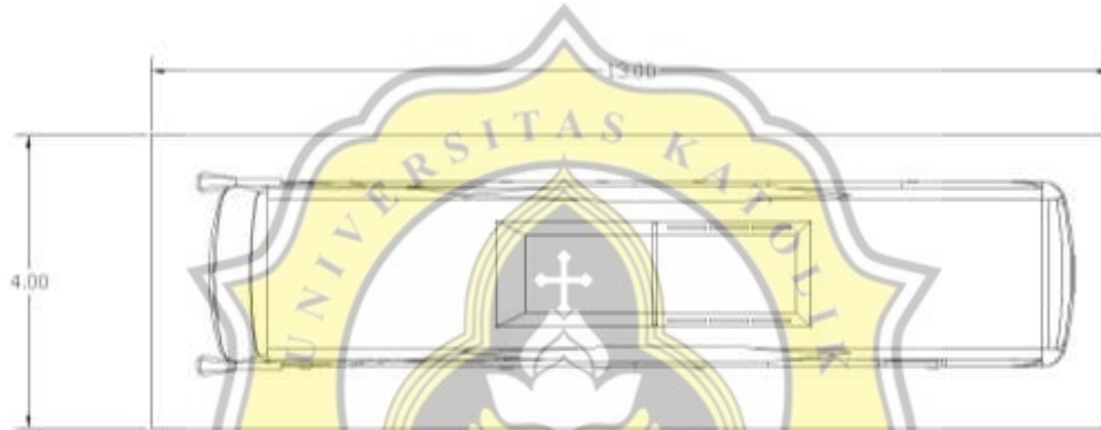
gambar 71. Ukuran bus pariwisata jenis jet bus