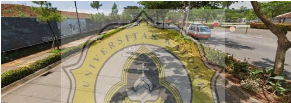
Gambar 69. Kondisi jalanan BSD city

Bsd city memiliki ukuran jalan dengan lebar sekitar 7 meter atau setara dengan 3 mobil dan 1 motor. Untuk jalan sendiri memiliki 2 jalur yang masing berukuran sekitar 7 meter. Dengan lebar jalan sebesar itu maka potensi macet pada daerah ini sangat kecil.