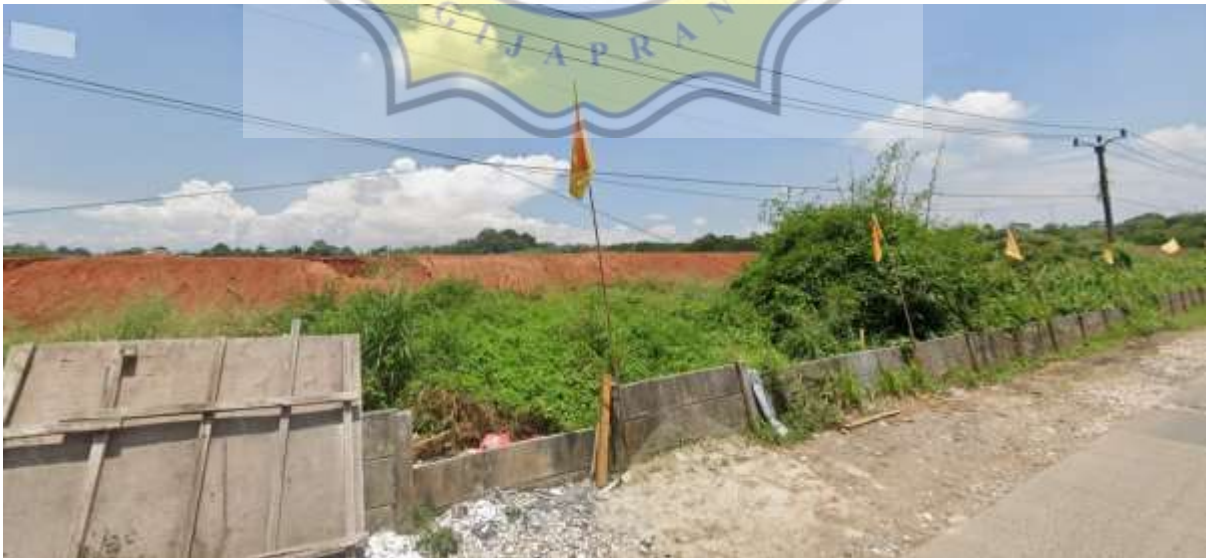
Gambar 68. Batas timur site