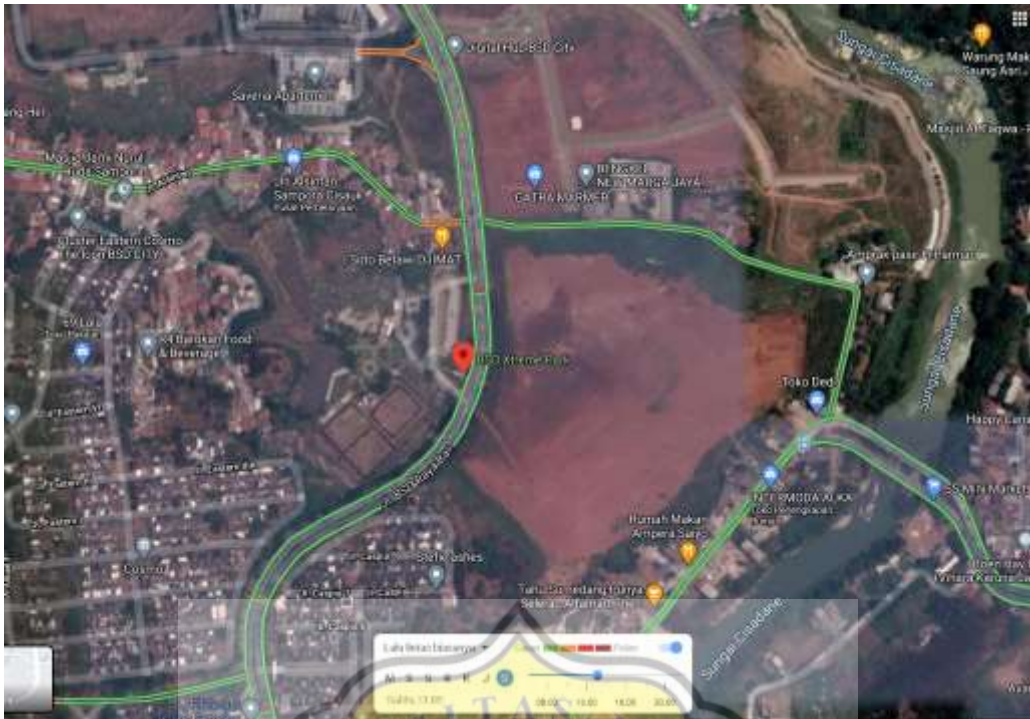
Gambar63. Peta Lalu Lintas BSD