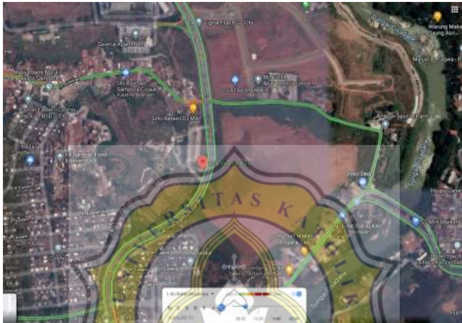
Gambar 61. Pet lalu lintas BSD