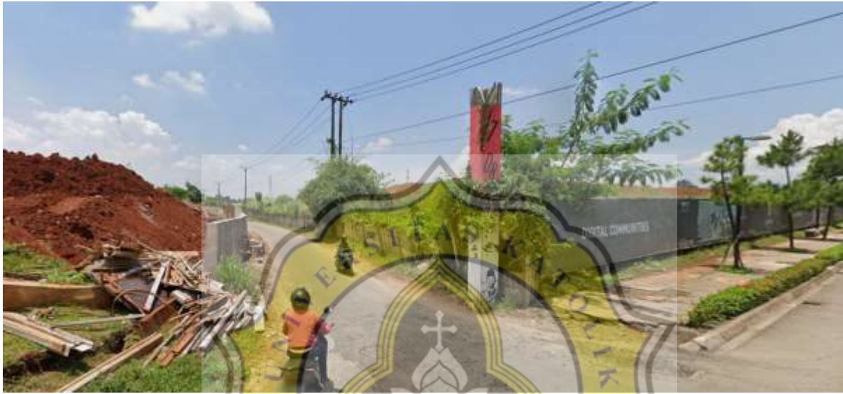
Gambar 67. Jalan di sebelah timur site