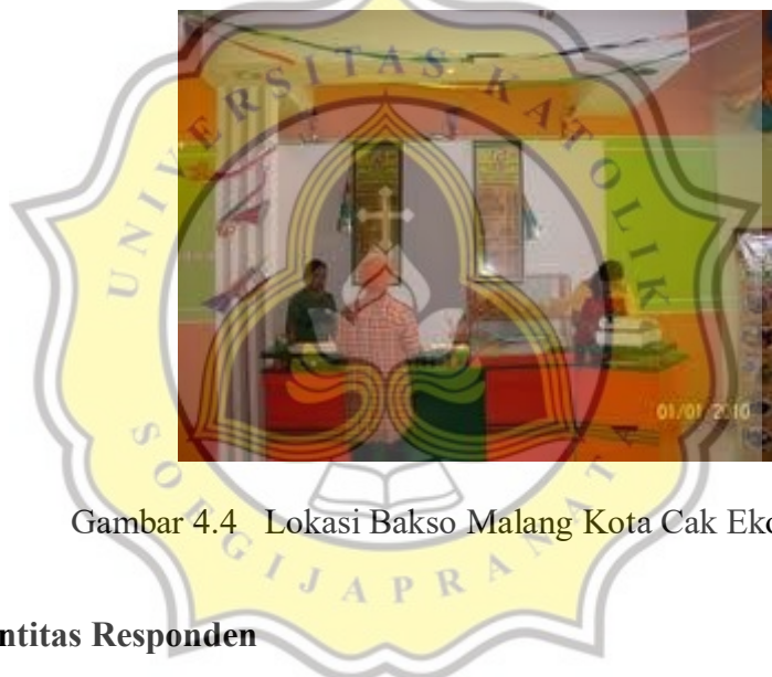
Gambar 4.4 Lokasi Bakso Malang Kota Cak Eko