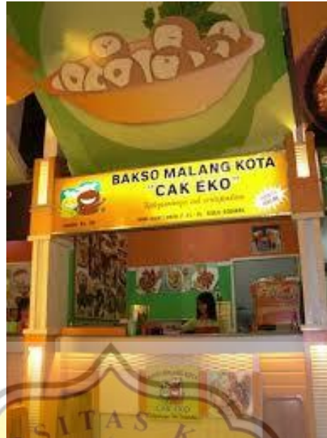
Gambar 4.1 Lokasi Bakso Malang Kota Cak Eko