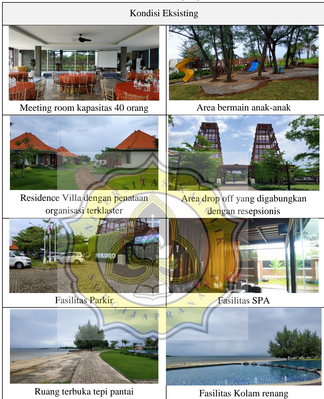
Tabel. 32 Kondisi Eksisting Sekuro Village Beach Resort Sumber : Observasi Lapangan, 2020