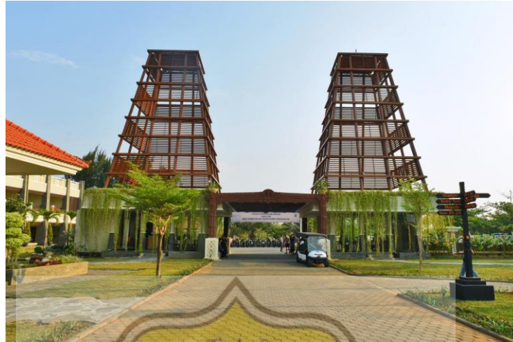
Gambar. 57 Sekuro Village Beach Resort