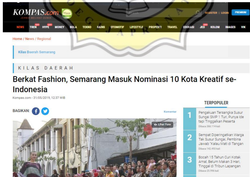
Gambar 8. 3 Berita Industri Fesyen

https://semarang.bisnis.com/read/20190623/536/936729/pengembangan-desain-berpotensi-dongkrak-penjualan-produk