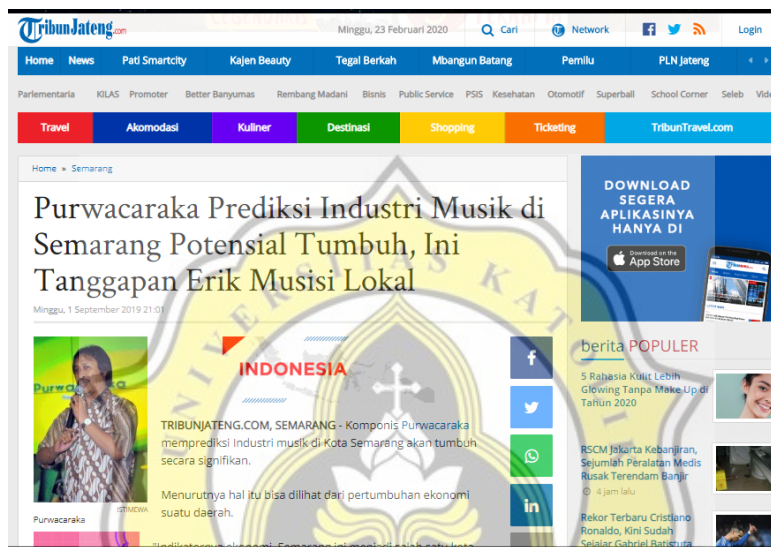
Gambar 8. 1 Berita Industri Musik

Pada Pusat Kreatif Berbasis Kebudayaan di Semarang menggunakan 3 subsektor ekonommi kreatif dari BEKRAF yaitu Desain Produk, Fesyen, dan Musik. Hal ini dikarenakan 3 subsektor ini memiliki potensi untuk menumbuhkan ekonomi daerah.