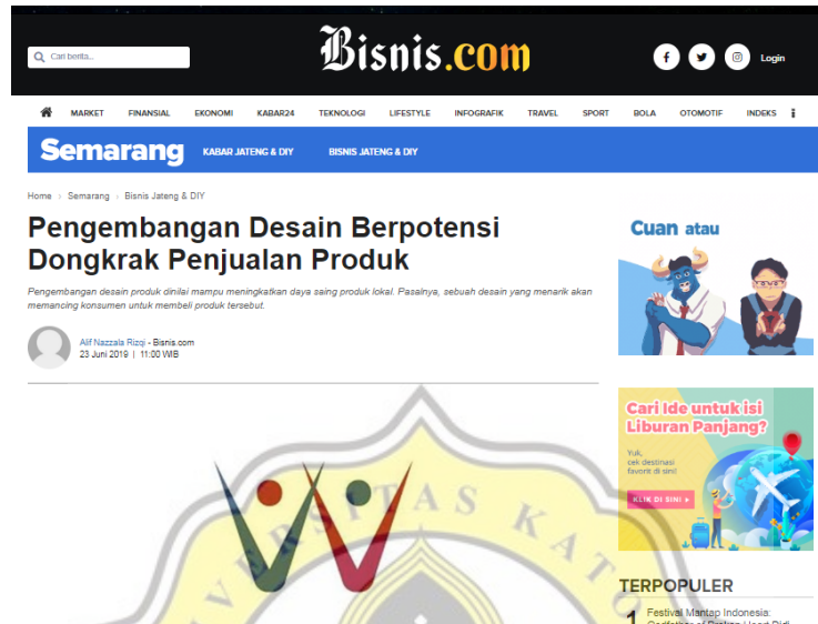
Gambar 8. 3 Berita Industri Desain Produk

https://www.ayosemarang.com/read/2019/03/08/38346/musisi-semarang-berpotensi-kembangkan-industri-kreatif