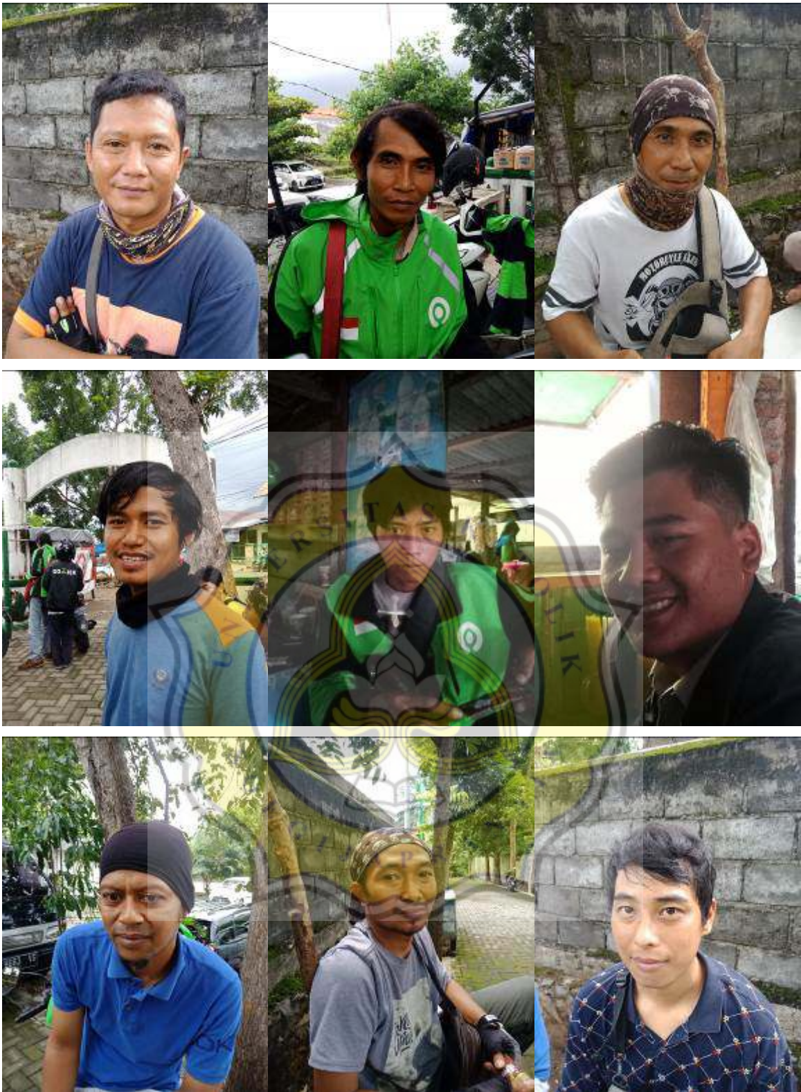
Lampiran 5 Beberapa foto narasumber yang bersedia untuk difoto