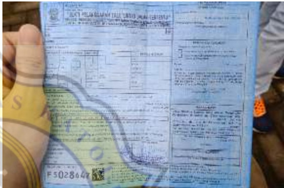
Lampiran 3 Foto-foto dokumentasi peneliti