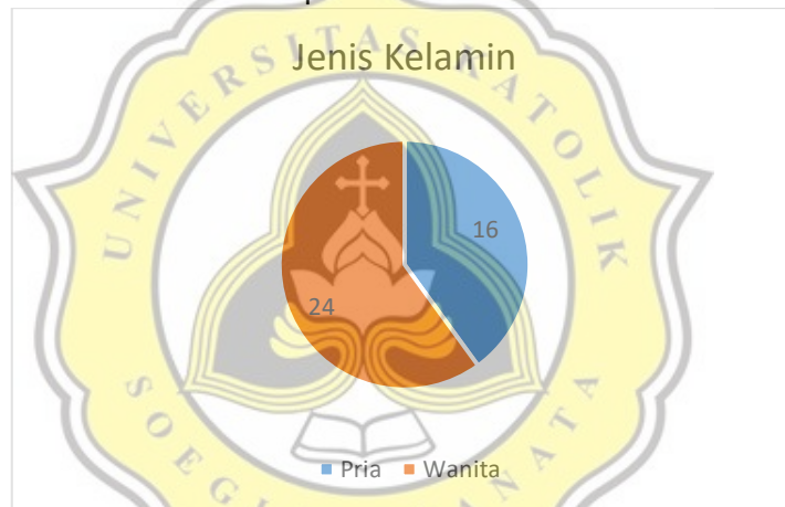
Grafik 4.1. Grafik Responden Berdasarkan Jenis Kelamin

Jumlah keseluruhan dari responden terdapat 40 responden yang turut mengisi kuesioner dalam bentuk google form . Responden berjenis kelamin wanita berjumlah 24 responden dari 40 responden keseluruhan, sedangkan untuk responden berjenis kelamin pria berjumlah 16 responden dari 40 responden keseluruhan.