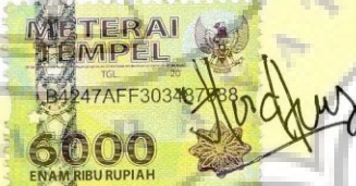
Ardhea Putri Prasmita