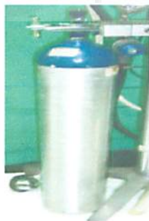
N 2 O (biru)

Peragaan pembiusan yang dilakukan Morton bulan Oktober pagi tahun 1846 itu merupakan peristiwa penting dalam sejarah manusia, mungkin tak ada kata-kata yang lebih tepat melukiskan hal ini ketimbang tulisan yang diukir di atas monumen untuk memperingatinya