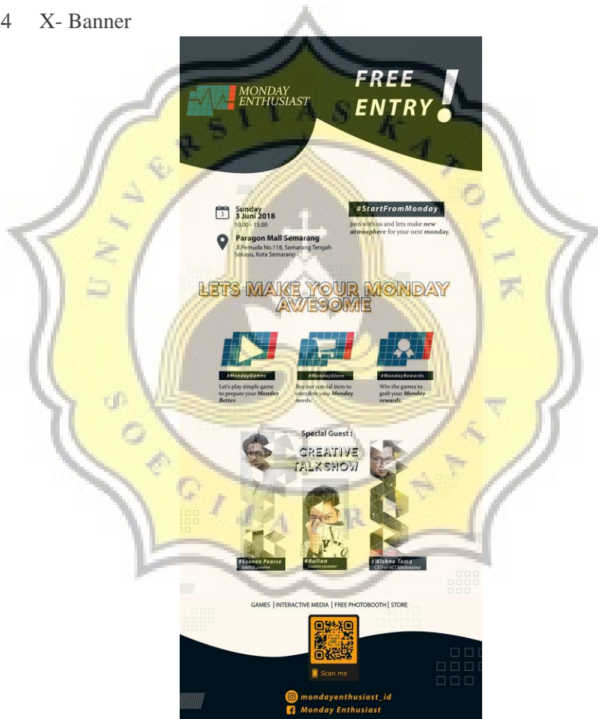
Gambar 4.5 Desain X- Banner