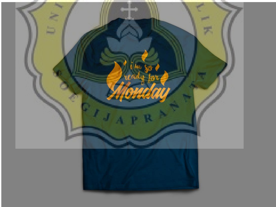
Gambar 4.6 T-Shirt