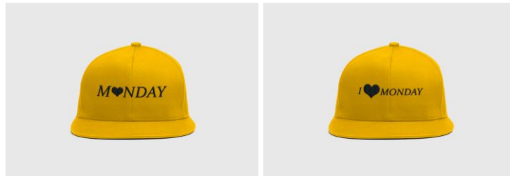
Gambar 4.7 Desain Topi