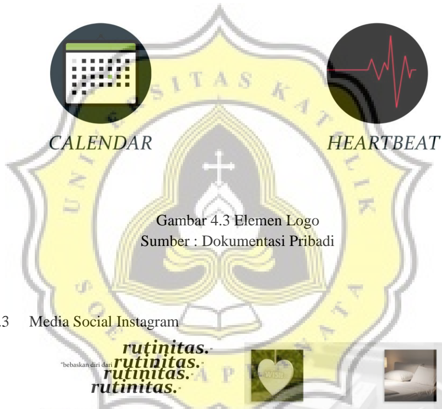
Gambar 4.3 Elemen Logo