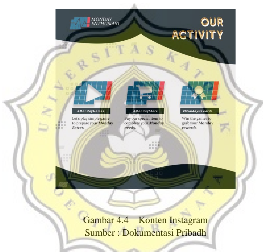
Gambar 4.4 Konten Instagram

Konten instagram terdiri dari beberapa macam tergantung dari hari yang ada. Untuk konsep penyebaran konten di instagram ditentukan sebagai berikut :