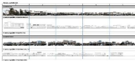
Gambar 3. Suasana dan fasade bangunan di jalan Pekojan

Sedangkan kawasan jalan Haji Agus Salim sejak pertama kali dibuat sudah digunakan hanya sebagai tempat usaha, yang artinya pada saat malamhari tibatidak ada orang yang menghuni di dalam bangunan pertokoan yang ada di sana.