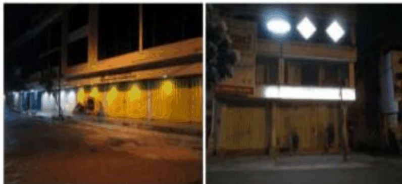
Gambar 10. Suasana kawasan jalan Penghela, Surabaya

Di Surabaya ada kawasan yang bernama Baluwerti yang di dalamnya memiliki karakter yang sama dengan jalan Pekojan.