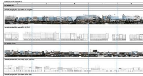
Gambar 4. Suasana dan fasade bangunan di jalan H. Agus Salim