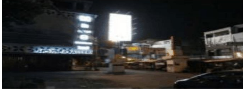
Gambar 9. Suasana kawasan Baluwerti Surabaya

Berdasarkan data yang diperoleh pada saat dilakukan FGD dengan penduduk / pengguna bangunan yang ada di kawasan pengamatan, didapatkan informasi bahwa tempat pengamatan memang hanya digunakan untuk beraktifitas di pagi sampai sore hari dan pada malam harinya digunakan sebagai gudang penyimpanan barang dagangan.