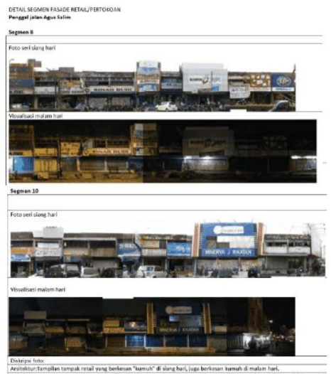
Gambar 7. Suasana dan fasade bangunan di jalan H. Agus Salim pada pagi dan malam hari pada bagian lain