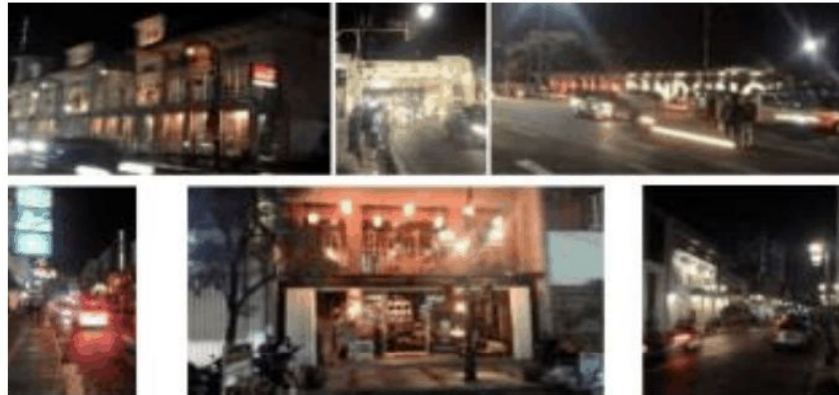
Gambar 11. Suasana kawasan jalan Braga , Bandung

Jika dilihat dari contoh studi kasus tersebut, maka dapat dilihat bahwa penerangan yang ada tidak berasal dari dalam bangunan, tetapi berasal dari penerangan jalan dan reklame yang ditempelkan di depan toko.