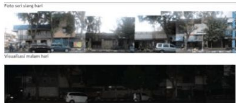
Gambar 2. Suasana pagi dan Malam hari di salah satu penggal jalan (Jl. Mataram, Semarang)

Dari gambaran tersebut dapat dilihat bahwa ada perbedaan yang sangat signifikan antara pagi dengan malam hari. Hal ini lah yang menjadi sebuah persoalan, dimana pada malam hari terjadi perubahan persepsi pengguna jalan. Dimana pada pagi hari orang merasa nyaman untuk berkegiatan karena segala sesuatu serba jelas, namun pada malam hari pengguna jalan tidak dapat menebak dengan jelas apa yang