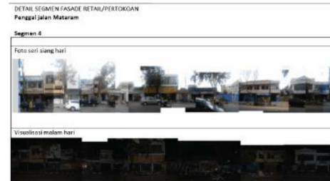
Gambar 8. Suasana dan fasade bangunan di jalan Mataram (jalan MT Haryono) pada pagi dan malam hari pada bagian lain

Dari gambar 6, 7 dan 8 yang ada dapat dilihat bahwa terjadi perbedaan yang cukup jauh antara pagi hari dan malam hari.