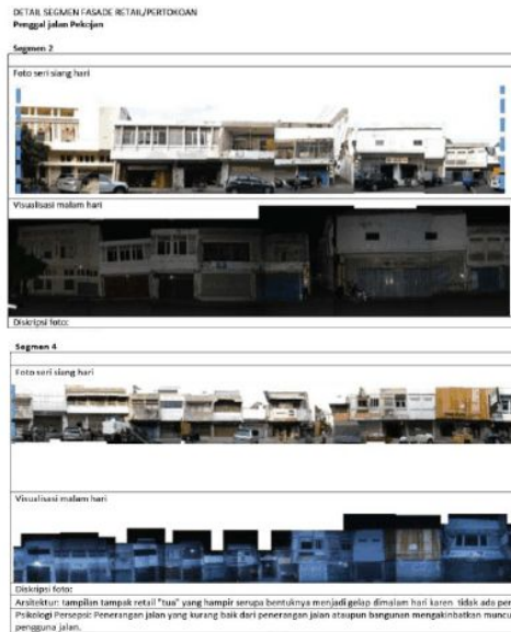
Gambar 6. Suasana dan fasade bangunan di jalan Pekojan pada pagi dan malam hari pada 1 bagian

lebih rendah dibandingkan dengan 2 ruas jalan yang lain.