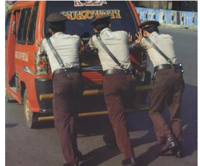
PARTISIPASI MASYARAKAT DENGAN INISIATIF BOTTOM-UP http://ikis.co.id/ (Suhartini et al)