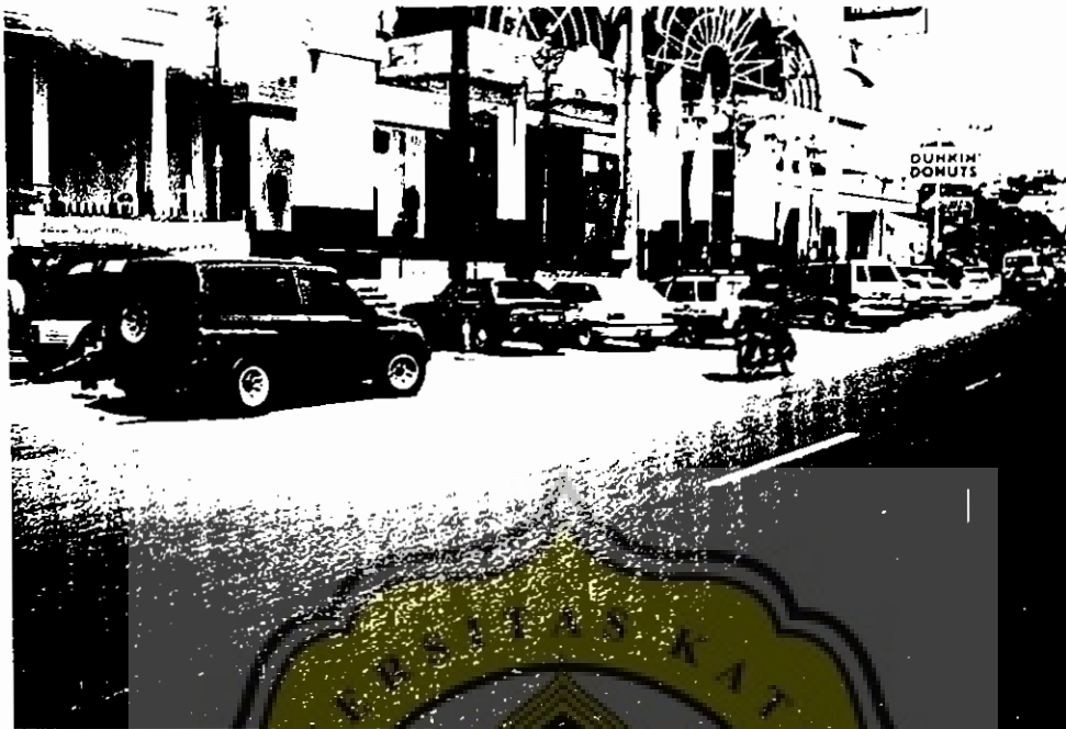
Lampiran 13 : Foto Parkir Liar Di Jalan Mataram