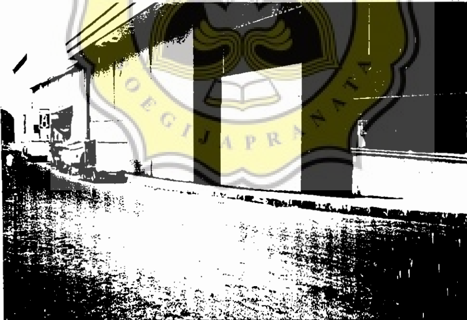
Lampiran 14 : Foto Parkir Liar Di Jalan Mangga III