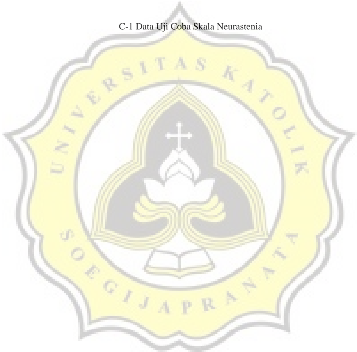
C-1 Data Uji Coba Skala Neurastenia