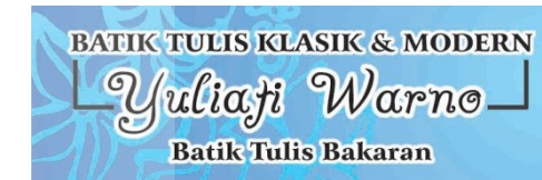
Batik Bakaran Yuliati Warno

Berdasarkan hasil wawancara dan observasi langsung kepada para pengrajin menyatakan bahwa di Juwan tepatnya di desa Bakaran terdapat kurang lebihnya 21 Pembatik Batik Bakaran yang rata – rata mereka mengenal Batik Bakaran dan mulai membatik sejak kecil secara turun menurun dari nenek moyang mereka.