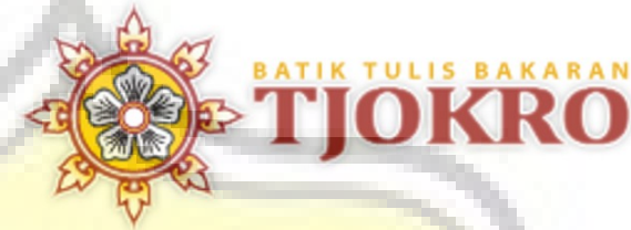
Batik Tjokro Juwana