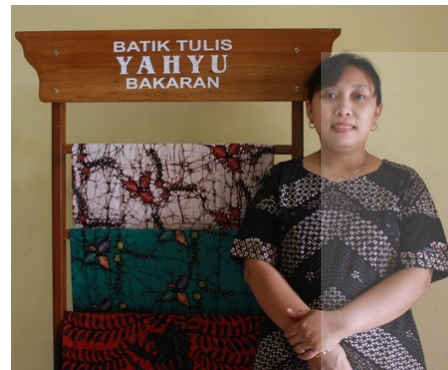
ANAK dari Ibu Yahyu