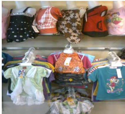
Gambar.Display 4 Toko Wijaya Collection