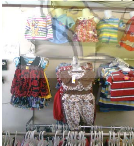
Gambar.Display 6 Toko Wijaya Collection