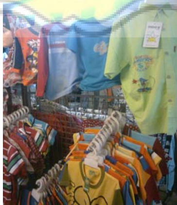
Gambar.Display 3 Toko Wijaya Collection