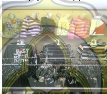
Gambar.Display 5 Toko Wijaya Collection