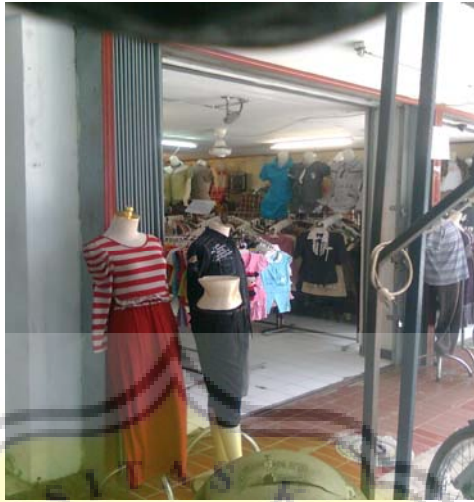
Gambar. Toko Wijaya Collection dari Samping