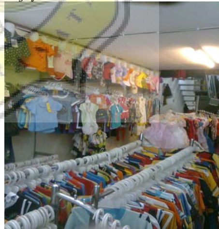
Gambar. Display 7 Toko Wijaya Collection