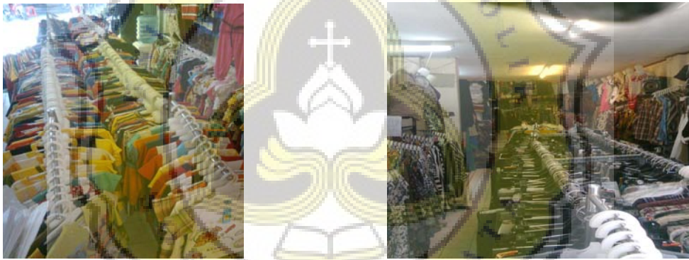
Gambar.Display 1 Toko Wijaya Collection Gambar.Display 2 Toko Wijaya Collection