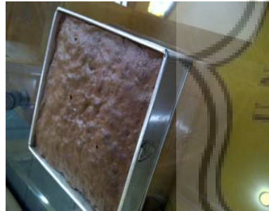
Brownies tepung oatmeal